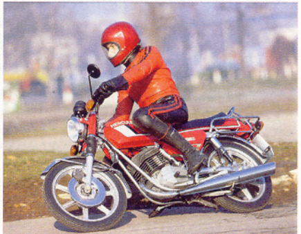
K 125 S, ein schnelles Kleinmotorrad