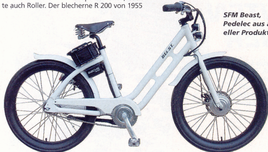
SFM Beast, Pedelec aus aktueller Produktion