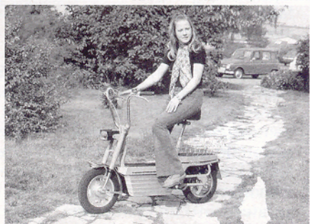
Accu-Bike von 1974

Natürlich wird ordentlich gefeiert: vom 24.-26. Juni im Nürnberger Museum Industriekultur. Tatkräftige Unterstützung leisten u.a. die Hercules IG, Hercules-Wankel-IG, Sachs-Biker-IG und natürlich die SFM GmbH. Über 150 Besitzer historischer Hercules haben sich angekündigt. Das Rahmenprogramm bietet viele interessante Vorträge und Exponate. Info unter www.herculesig.de im Internet.