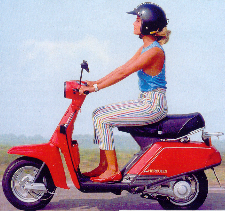
Hercules CV 50/80, made by Yamaha